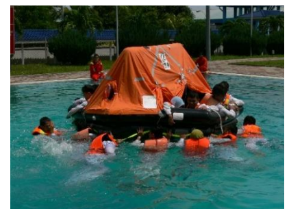
Gambarajah 3: Rakit Keselamatan untuk 25 orang yang telah dilancarkan