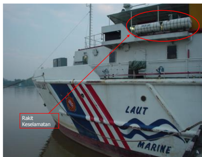
Gambarajah 2: Rakit Keselamatan atas kapal