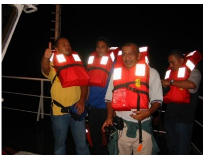
Gambarajah 1: Penumpang memakai Jacket Keselamatan (Lifejacket).